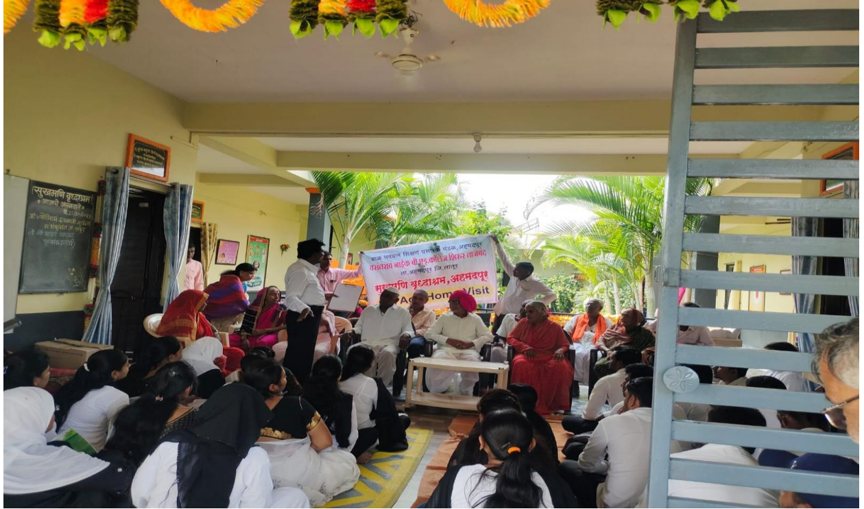
Old Age Home