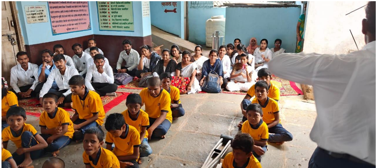
Special School Visit