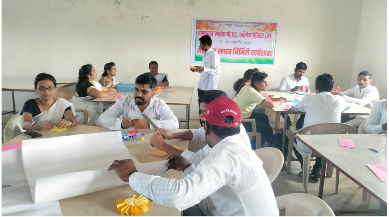
Art and Craft